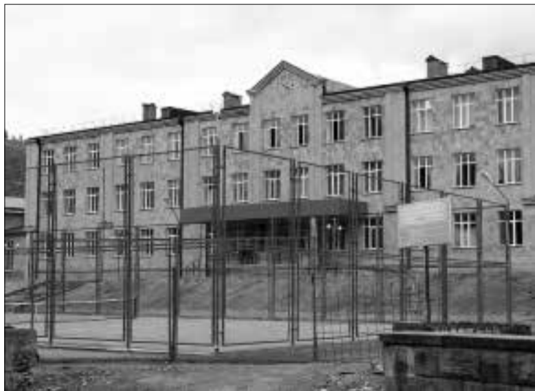
ուրբաթից շուրջ եկավ, և շենքի փլուզումից հետո «Քվե» ՍՊԸ-ի նոր նախագիծը մրցույթում հաղ-

Կապանի N2 ավագ դպրոցի նորակառույց շենքը հոկտեմբերի 6-ին իր դռները բացեց աշակերտների առջև: Հիշեցնենք, որ 2011թ. հուլիսի 17-ին ամրացման աշխատանքի ընթացքում շենքը փլուզվել էր, բարեբախտաբար փուժածներ չկային: Դպրոցի շինարարական աշխատանքները սկսվել են 2011թ. նոյեմբերից, պատվիրաբուն՝ ՀՀ քաղաքաշինության նախարարության «Քաղաքաշինական ծրագրերի իրականացման գրասենյակ» պետական հիմնարկն է, իսկ աշխատանքները կատարել է «Սիսիանի նոր բակ նորոգչին» ԲԲԸ-ն: Նախապես հայտարարված մրցույթում հաղթող ճանաչված կազմակերպությունը մինչ դպրոցի փլուզումը պիտի կատարեր հիմնանորոգման աշխատանքներ: Բայց, ինչպես ասում են, շաբաթն