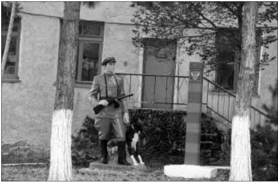
ՍԿԻՉԲԸ ԷՋ 1

անցնել սահմանը, մեզ անկասկած հայտնի կլինի, եւ մենք կկանգնենք սահմանախախտի ճանապարհին: Իսկ այս պահի դրությամբ կասեմ, որ ամեն ինչ հանգիստ է: Ինչ վերաբերում է տեղի բնակչությանը, ապա նրա հետ նույնպես համագործակցում ենք եւ մշտապես զգում մարդկանց աջակցությունը: